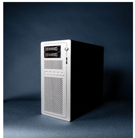
Kompaktes Midi-Tower-Gehäuse der AI-Workstation