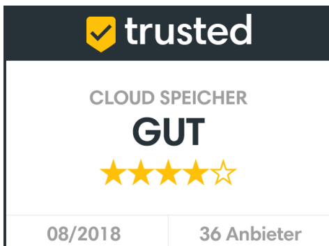
Bildtext: PROOM im Test bei trusted unter den Top-Anbietern für Cloud-basierte Austauschplattformen